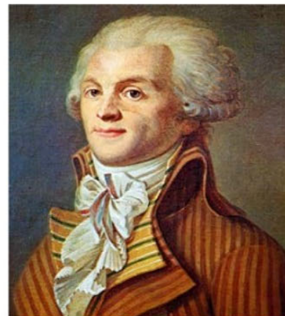
Maksymilian Robespierre (*1758 †1794) był z zawodu prawnikiem. Nazywano go „Nieprzekupnym”, gdyż mimo swoich radykalnych poglądów słynął z uczciwości.

Radykalizm – postawa dążąca do przeprowadzenia głębokich zmian w życiu społecznym i politycznym, nawet z wykorzystaniem drastycznych metod.